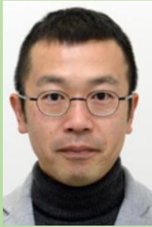
講演1：西村 明 東京大学大学院人文 社会系研究科准教授