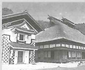
気仙大工左官伝承館